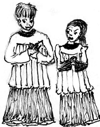
Ilustrace: Eva A. M.

Ministrant je především Kristův služebník, při mši svaté slouží jak Pánu, tak i všem přítomným věřícím. Jeho důležitá role může být zdůrazněna třeba tím, že do kostela přichází slušně a čistě oblečený, ostatně ministrantský „dres“ vždycky neskryje všechno oblečení. Ministrant také ví, jak se v kostele chovat, že se nesměje, kdykoli se stane nějaká, pro něj ohromně zábavná událost, jaké jsou rozdíly mezi stáním, poklekáním a sezením! Oblečení ministranta představují především: rocheta superpelice – bílé delší roucho s dlouhými rukávy. Pod rochetu se obléká černá dlouhá klerika , kterou je možno nahradit dvoudílným oblečením, tedy černou suknicí a komží s límcem. Kněz mívá albu , dlouhé bílé šaty ke kotníkům, pod albou kolem krku může mít humerál – čtyřhranný šátek s tkanicemi. Na albě kněz nosí štolu – dlouhý ozdobný pás kolem krku. Navrch pak používá při mši ornát – roucho s otvorem pro hlavu. Pokud kněz neslouží mši, mívá na sobě (pokud zrovna nepracuje na zahradě v montérkách ☺) kleriku , dlouhý černý oděv po kotníky s bílým kolářkem kolem krku.